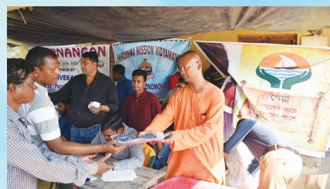
সমাজসেবায় স্বপ্নাঙ্গন ও খেয়া