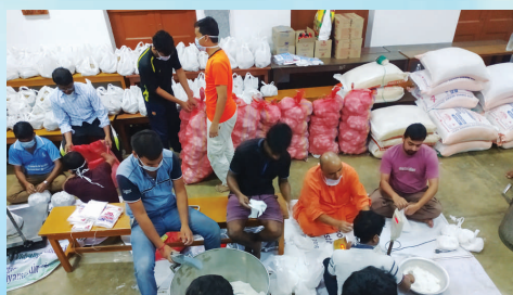
করোনা রিলিফে বিদ্যামন্দিরের ছাত্র ও সন্ন্যাসীরা