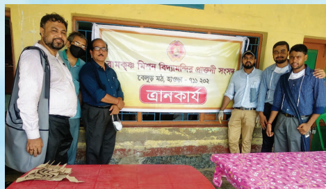
ঘোড়ামারায় উপস্থিত সংসদের প্রতিনিধিরা