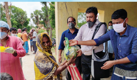
রিলিফের কাজে দুর্গতদের পাশে

বিদ্যামন্দির পরিবারের পরবর্তী পুনর্মিলন উৎসব অনুষ্ঠিত হওয়ার কথা ছিল আগামী বছর ২০২১-এর ফেব্রুয়ারি মাসে। করোনার ভয়াবহ প্রকোপের ফলে পুনর্মিলন উৎসবের যথাযথ প্রস্তুতি নেওয়া সম্ভব হচ্ছে না। গত ১ আগস্ট, ২০২০ তারিখে কার্যকরী সমিতির ভার্চুয়াল সভায় স্থির হয়েছে যে, বর্তমানে পুনর্মিলন উৎসব আপাতত স্থগিত থাকবে। উৎসবের দিনক্ষণ সংসদের ওয়েবসাইটে ( www.alumnividyamandira.in ) যথাসময়ে জানিয়ে দেওয়া হবে।