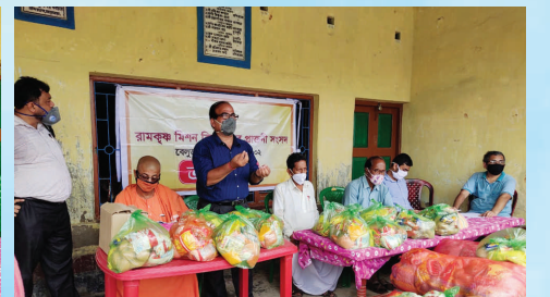
সমবেত মানুষদের উদ্দেশ্যে সম্পাদকের ভাষণ