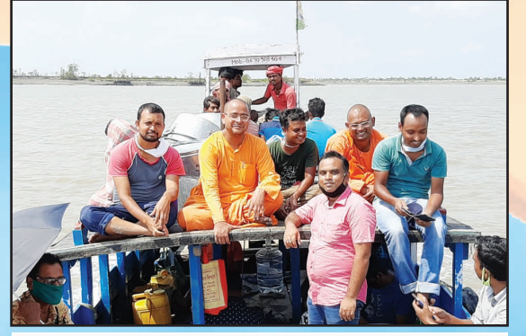
আমফান রিলিফে হিঙ্গলগঞ্জে ছাত্র ও সন্ন্যাসীরা