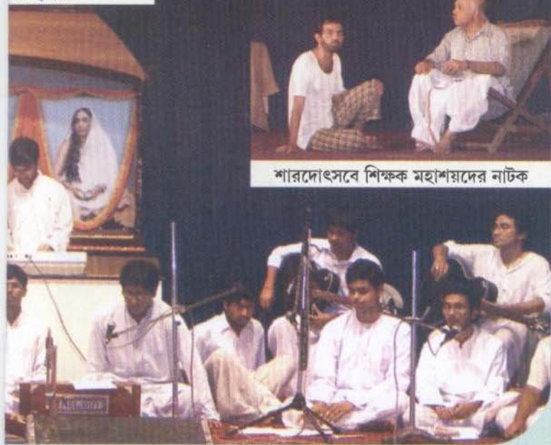
শারদোৎসবে শিক্ষক মহাশয়দের নাটক

an interesting interaction with the archeologists enriched the students. Teachers and students of Microbiology Dept. visited Deoghar. In the month of December teachers and students of Economics Dept. went to Ranchi and visited the KVK and other rural development projects of the Ranchi Centre of the Ramakrishna Mission.