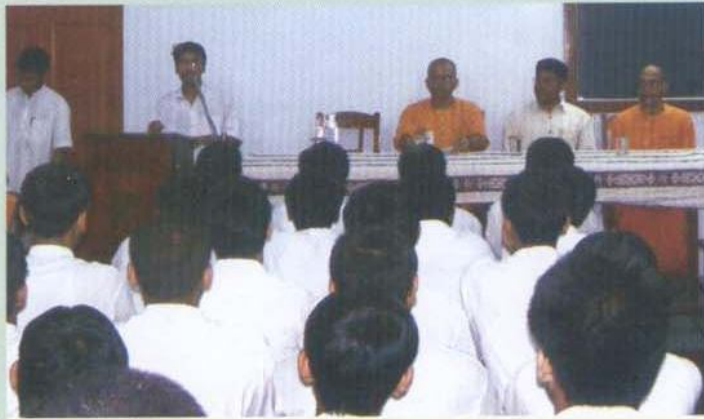
সদভাবনা দিবস উৎসাহন