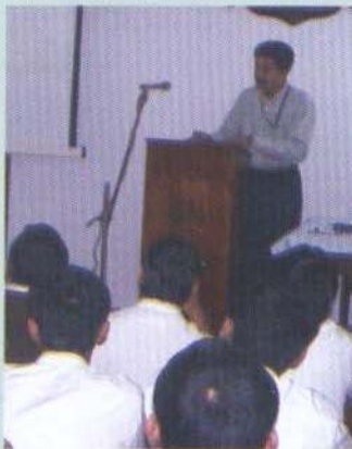
Camups Interview-তে TCS

First-aid Training Programme : The programme was organised in two phases by the Indian Academy of Health and Hygiene. The training was compulsory for the N.S.S. volunteers of the 1st Year class. Altogether 175 students were given the training and were provided certificates.