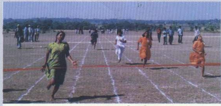
জেলাস্তরের দৌড় প্রতিযোগিতা