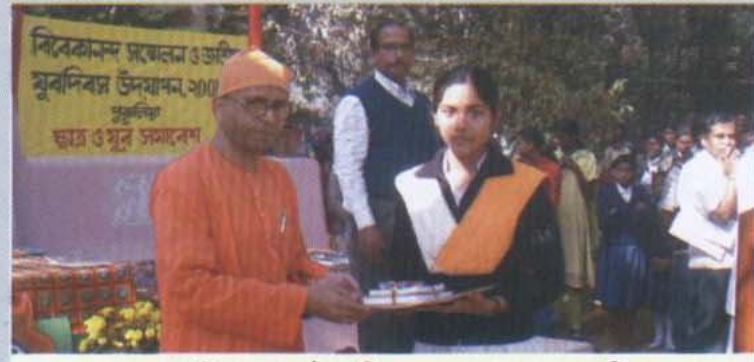
পুরস্কার বিতরণ অনুষ্ঠান, বিবেকানন্দ সম্মেলন, পুরুলিয়া