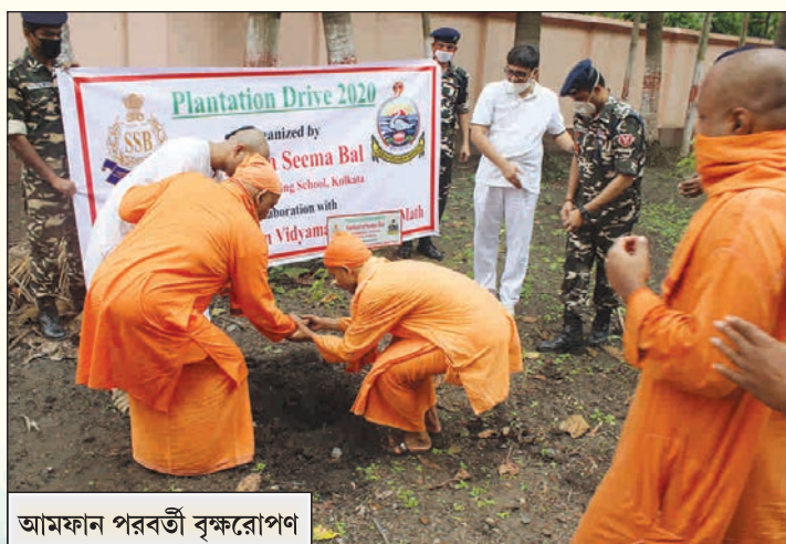
আমফান পরবর্তী বৃক্ষরোপণ