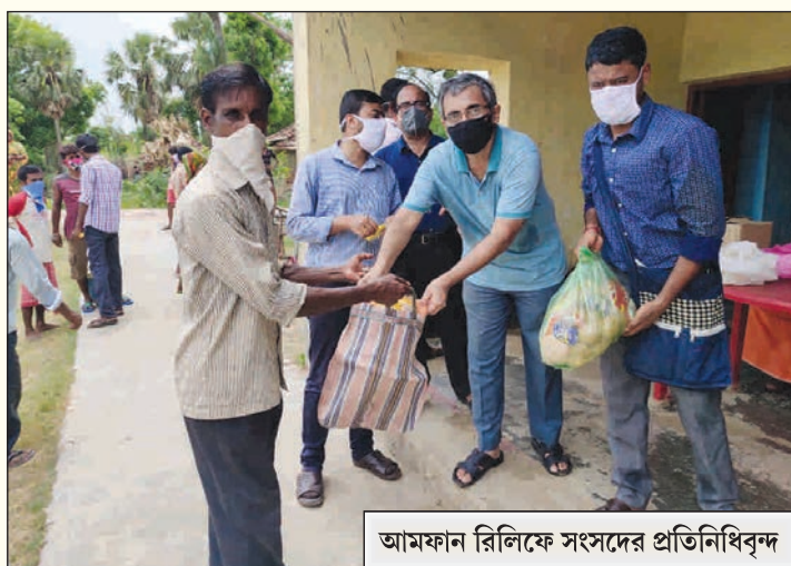
আমফান রিলিফে সংসদের প্রতিনিধিবৃন্দ