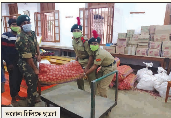
করোনা রিলিফে ছাত্ররা