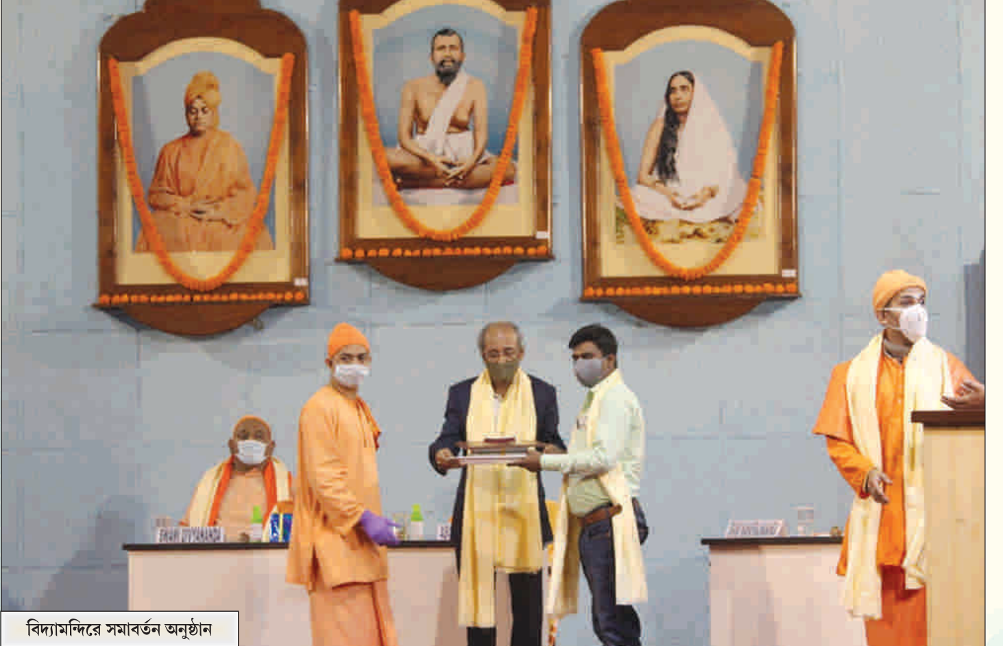
বিদ্যামন্দিরে সমাবর্তন অনুষ্ঠান