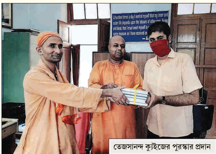
তেজসানন্দ কুইজের পুরস্কার প্রদান