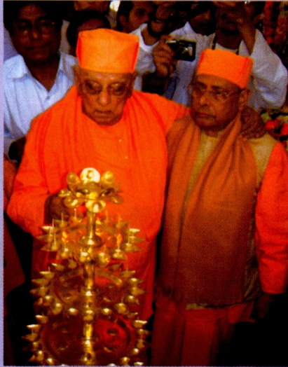
শিক্ষামূলক প্রদর্শনীর উদ্বোধন করছেন পরম পূজনীয় সংঘাধ্যক্ষ মহারাজ