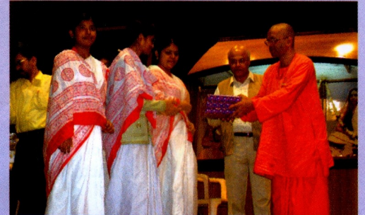
স্বামী তেজসানন্দ স্মারক কুইজ প্রতিযোগিতায় রানার্স আপ দল