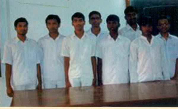
২০১০-১১ অর্থবর্ষে 'Graduates of 71' স্কলারশিপ প্রাপ্ত ছাত্ররা

অনুষ্ঠিত হবে। এটি রজতজয়ন্তী উৎসবের সর্বশেষ অনুষ্ঠান। গত জুলাই, ২০১১-এ প্রকাশিত প্রাক্তনীবার্তায় এই পুনর্মিলন উৎসবের তারিখ ঘোষণা করা হয়েছে এবং প্রকাশিতব্য স্মরণিকায় বিজ্ঞাপনের হারও দেওয়া হয়েছে। আমরা সকলেই চাই যত বেশী সংখ্যক সম্ভব প্রাক্তনী এই উৎসবে যোগদান করুন। একটি শিক্ষা প্রতিষ্ঠানের প্রাক্তনী গোষ্ঠী সেই প্রতিষ্ঠানের অন্যতম স্তম্ভ। বিদ্যামন্দিরের নানা উন্নয়নমূলক কাজে তাই প্রাক্তনীদের উচিত সক্রিয়ভাবে এগিয়ে আসা। আমরা যেন আমাদের সারস্বত স্বপ্নের কথা ভুলে না যাই।