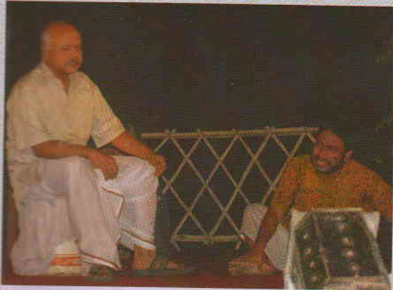
শরদোৎসবে শিক্ষক-শিক্ষার্থীদের নাটকের একটি দৃশ্য