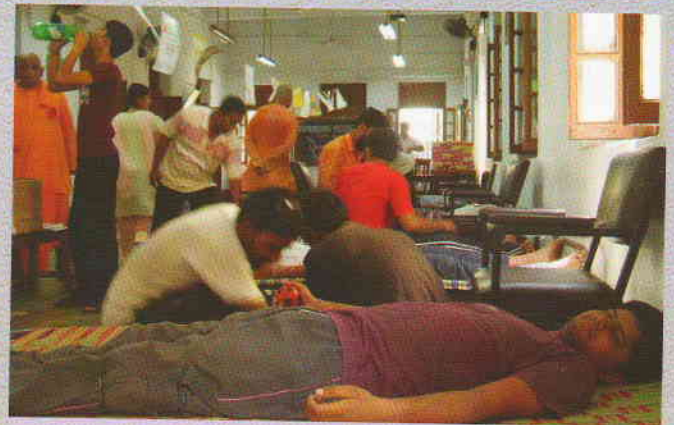
বিদ্যামন্দিরে রক্তদান শিবির