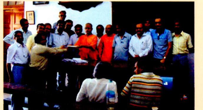
১৯৬৮-৭১-এর ব্যাচের তৃতীয়বারের আর্থিক অনুদান