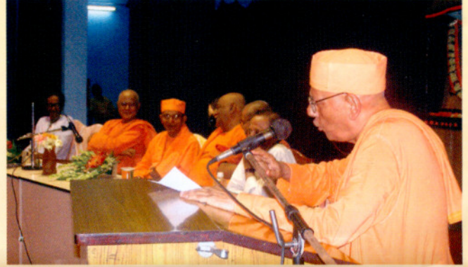
স্বায়ত্বশাসনের সূচনা এবং ত্রিবার্ষিক ডিগ্রী কোর্সের সুবর্ণজয়ন্তী