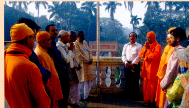
পুনর্মিলন উৎসবে পতাকা উত্তোলনের পরে বৈদিক মন্ত্রপাঠ

সকলেরই গম্ভব্য এবার খাবার ঘর। সকলেই বেশ তৃপ্তির সঙ্গে মধ্যাহ্নভোজন পর্ব শেষ করেন। সুযোগ বুঝে অনেকেই ঘুরে বেড়ান ছাত্রাবাসের এদিকে-ওদিকে—বোধকরি ফেলে আসা স্মৃতির গন্ধ-স্পর্শ পেতে। অনেকেই পরিবারবর্গকে সোৎসাহে দেখাতে থাকেন কোথায় কেটেছে তাঁদের ছাত্র-জীবনের কয়েকটি বছর।