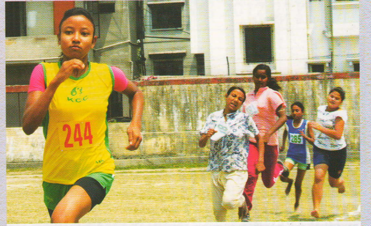
বিবেকানন্দ সম্মেলন : ছাত্রীদের দৌড়