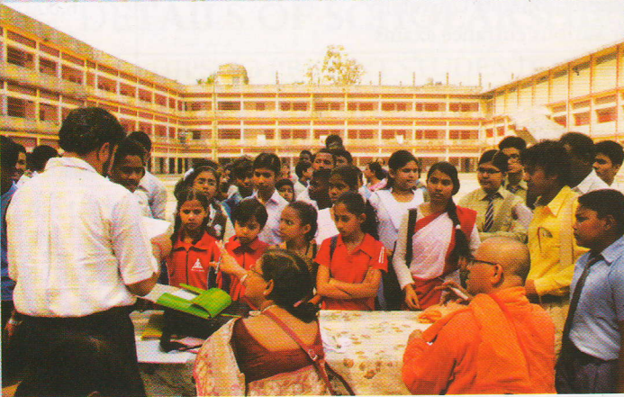
বিবেকানন্দ সম্মেলন : দিনের শুভারম্ভ