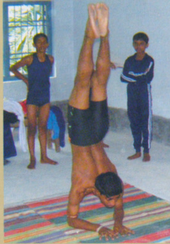
জেলাস্তরের যোগাসন প্রতিযোগিতা