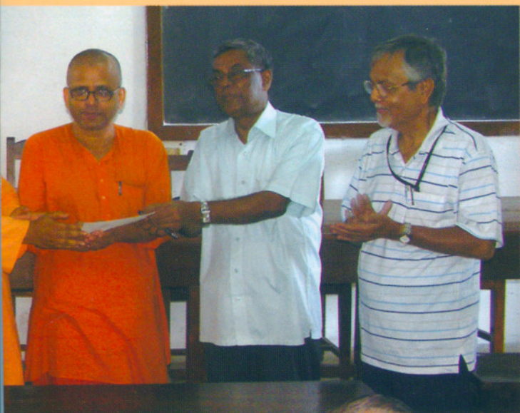
১-র আর্থিক সহায়তা