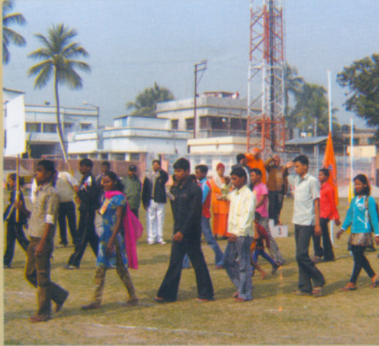
জেলাস্তরের দৌড় প্রতিযোগিতার সূচনার শোভাযাত্রা