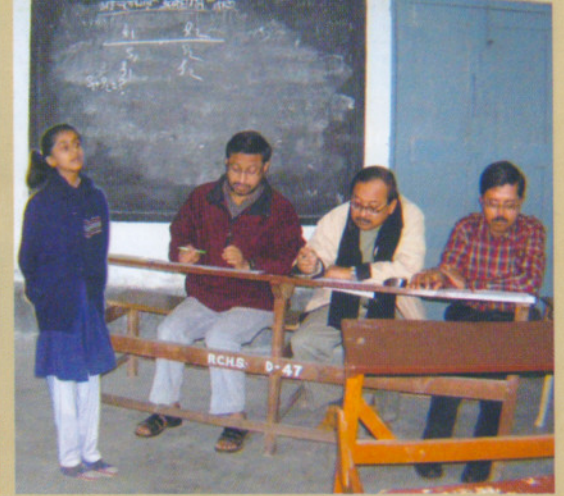
জেলাস্তরের আবৃত্তি প্রতিযোগিতা